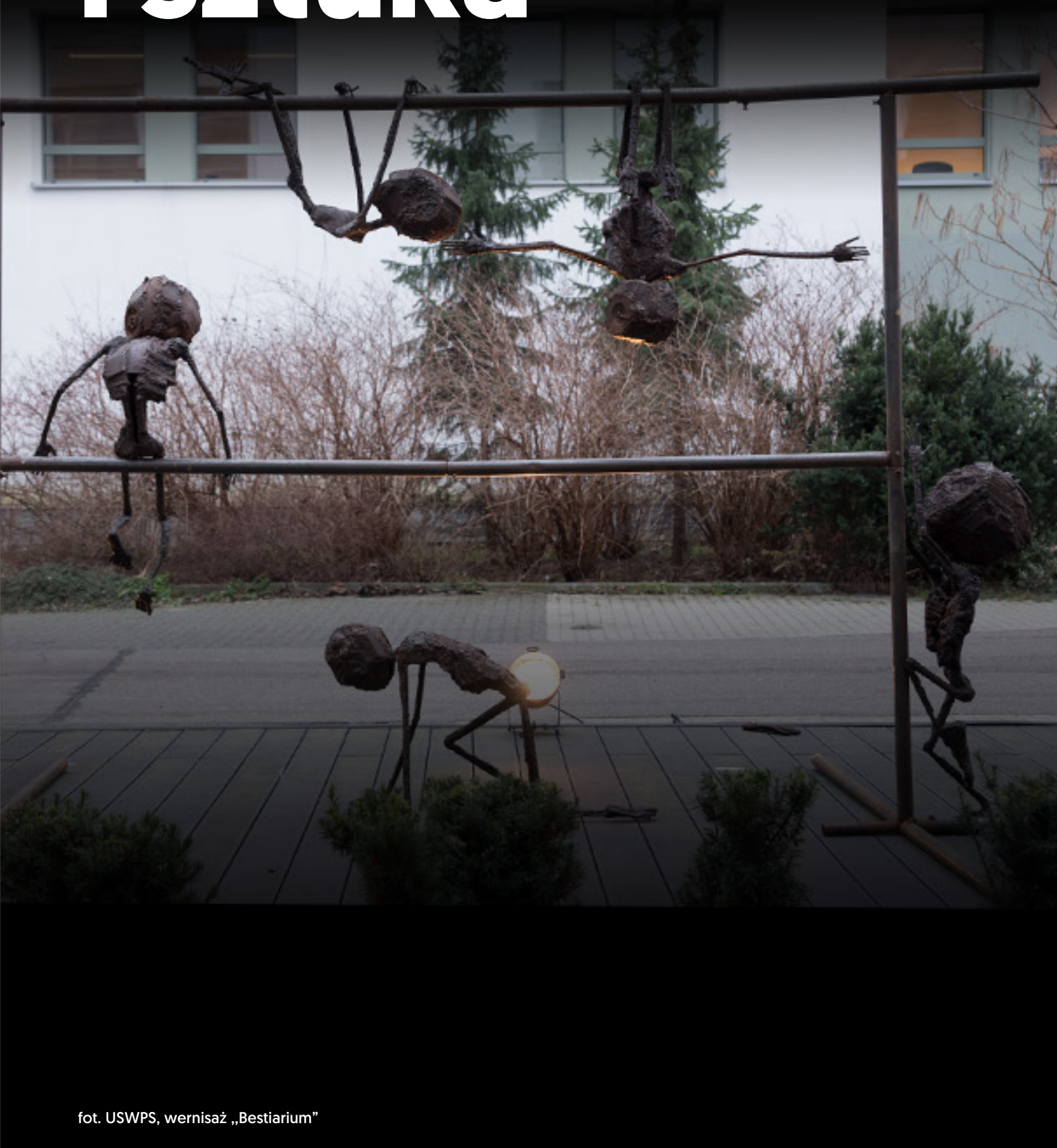
wernisaż „Bestiarium”

Naukę ujmujemy jako tworzenie nowej wiedzy oraz znajdowanie dla niej nowych zastosowań, a sztuki plastyczne jako tworzenie kultury materialnej i wizualnej.